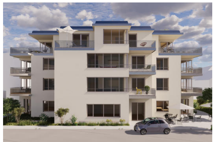
Ansicht von der Munderkinger Straße mit vier parallelen Parkbuchten.