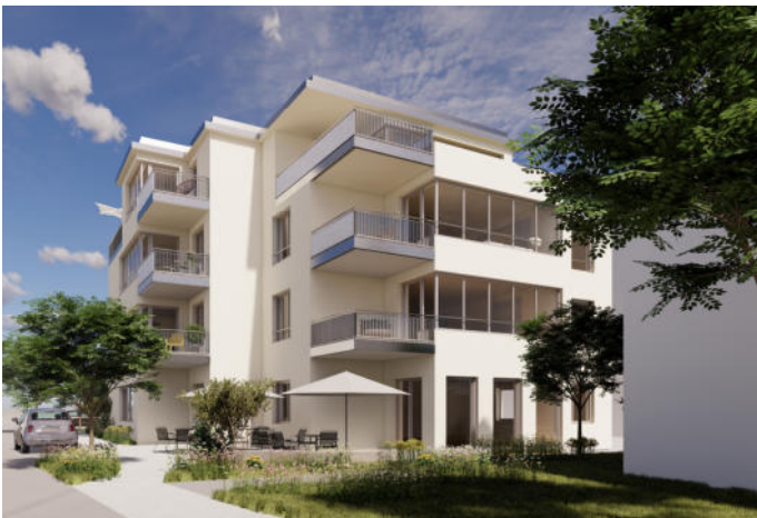
Ansicht aus Richtung Wolfgangskapelle mit Gewerbeeinheiten im Erdgeschoss und Außenfläche.

Der Gemeinderat bewertete das Vorhaben äußerst positiv: Angesichts des knappen Mietwohnraums stellt die Schaffung von neun Wohneinheiten einen wichtigen Beitrag zur Zukunftsfähigkeit der Gemeinde dar. Auch die Schaffung von Gewerbeflächen und insbesondere die mögliche Ansiedlung einer Bäckerei als Nahversorger im unteren Dorfbereich wurde als Bereicherung für die Einwohnerinnen und Einwohner gewürdigt.