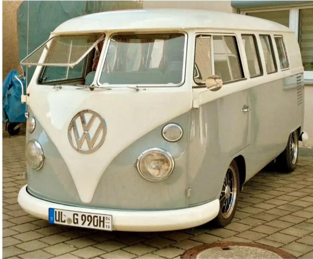
Türk legte den Bus von 1964 tiefer und erneuerte die Felgen.

Vor zwei Jahren erweiterte die Familie dann die Bulli-