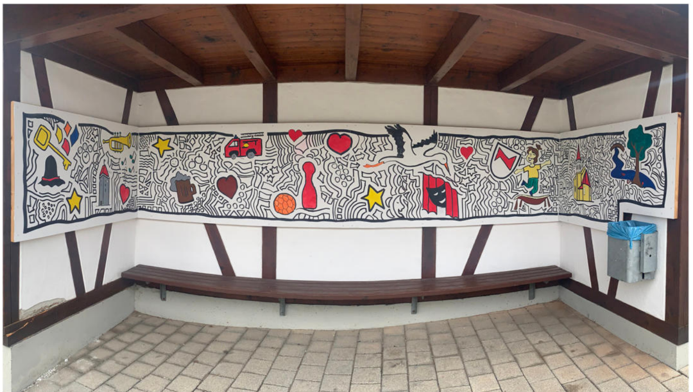
Das fertige Bild aus dem Ferienprogramm Bushaltestelle-Bemalen.