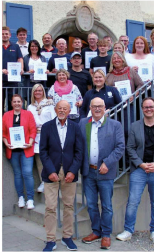
Ehre wem Ehre gebührt