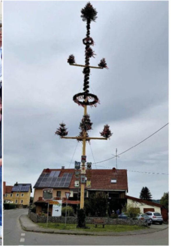
Der Siegerbaum in diesem Jahr steht in Emerkingen.