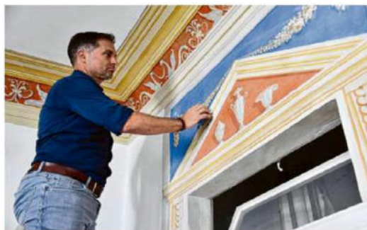
Die Architekturmalerie im Realschulgebäude wurde vor allem gereinigt und erstrahlt nun ebenfalls wieder in neuem Glanz.

In Obermarchtal ist der Zustand der Bausubstanz besser. Trotzdem: Ohne vorherige Putz- und Farbumtersuchung ging es